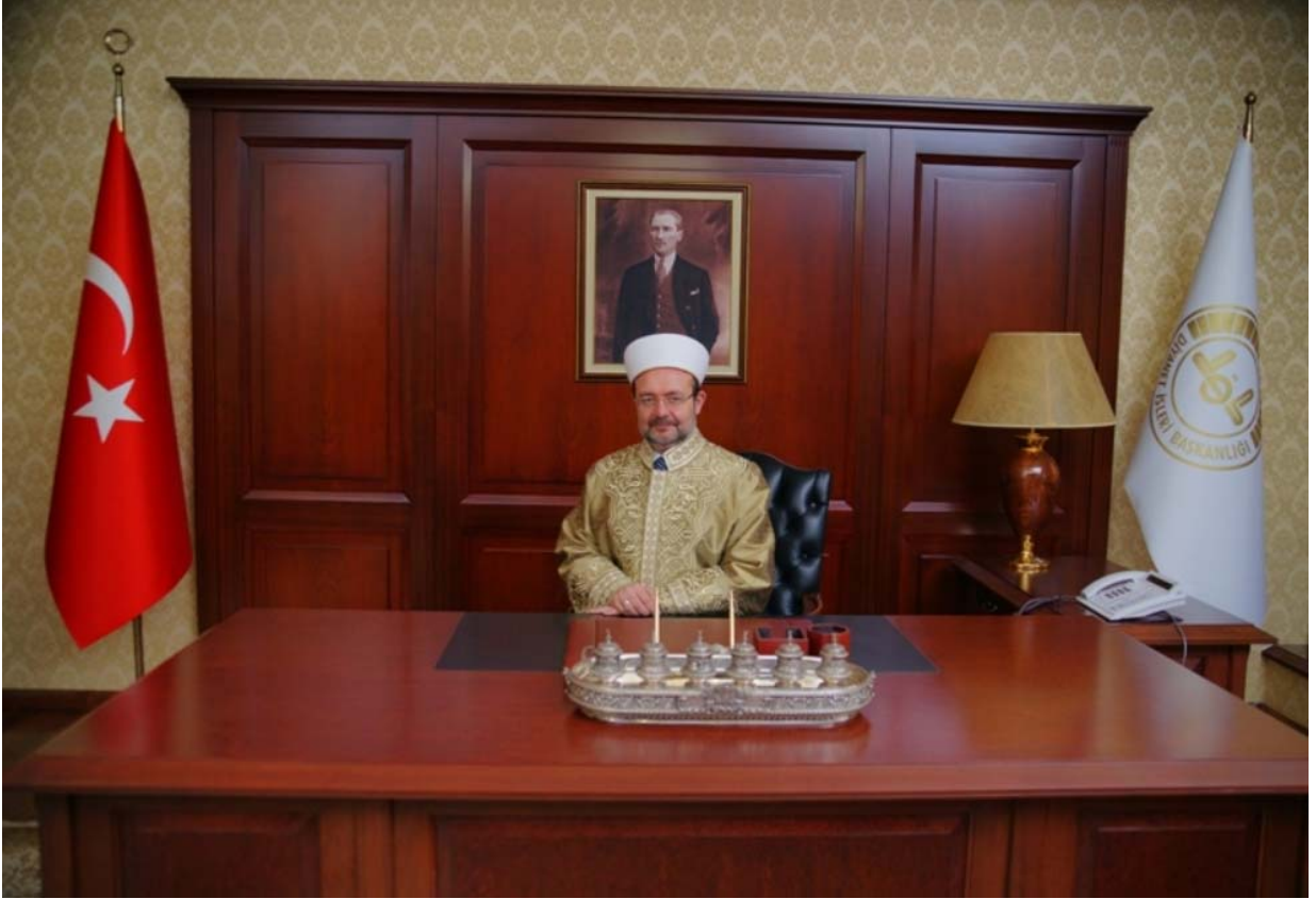
Prof. Dr. Mehmet GÖRMEZ Diyanet İşleri Başkanı