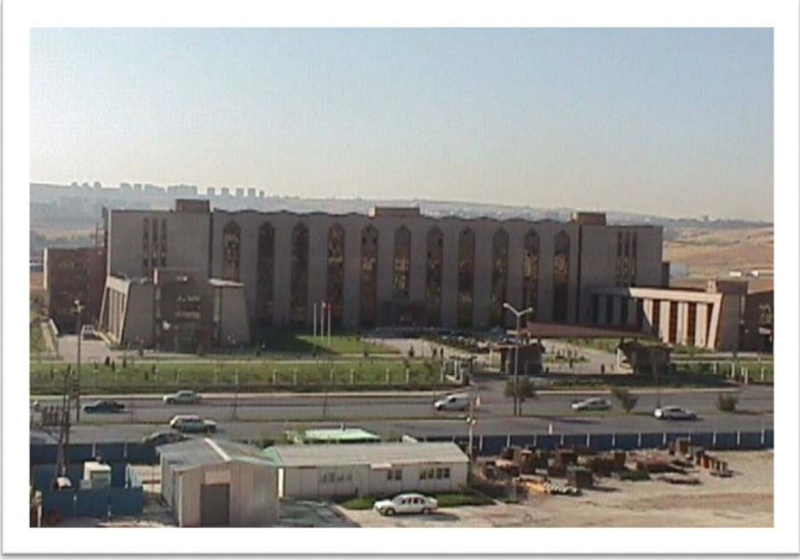
Resim 4 - Başkanlık Hizmet Binası (Karşıdan Görünüm)