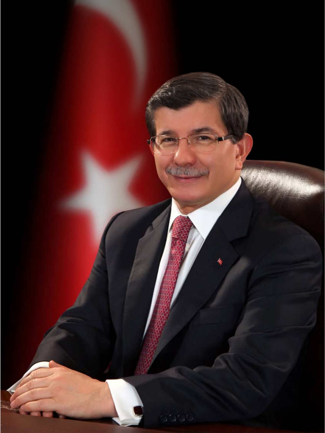
Prof. Dr. Ahmet DAVUTOĐLU Başbakan